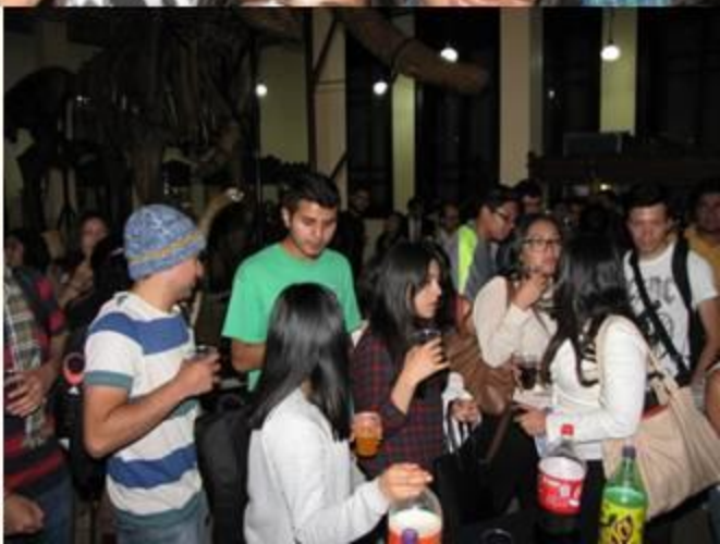
PTT, DISEÑO Y FOTOS: HOMERO MTZ FLOTTE