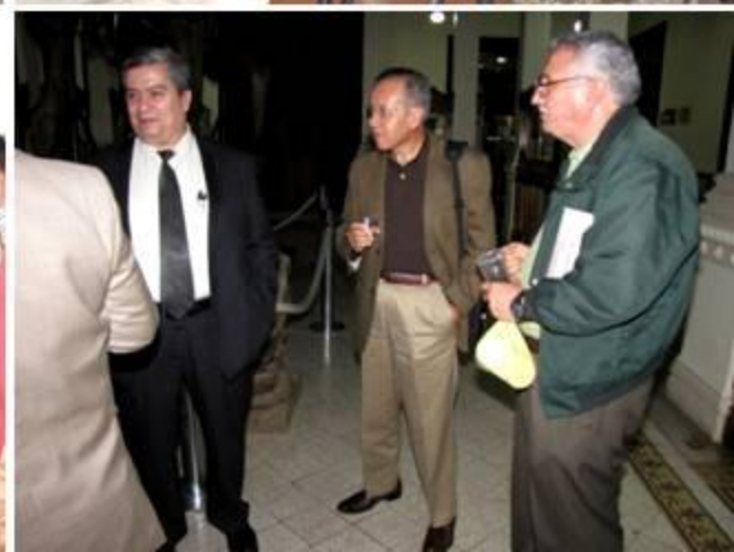
PTT, DISEÑO Y FOTOS: HOMERO MTZ FLOTTE